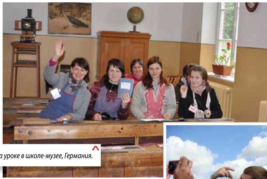
На уроке в школе-музее, Германия.