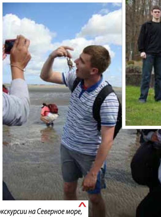
Были и экскурсии на Северное море, г. Вильгельмсхафен (Германия).