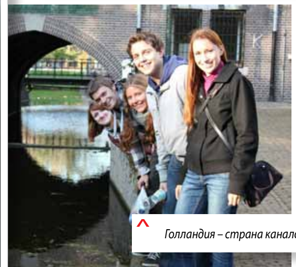
Голландия – страна каналов.