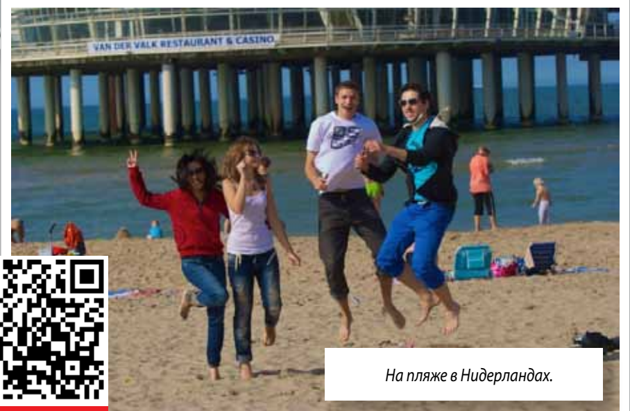
На пляже в Нидерландах.