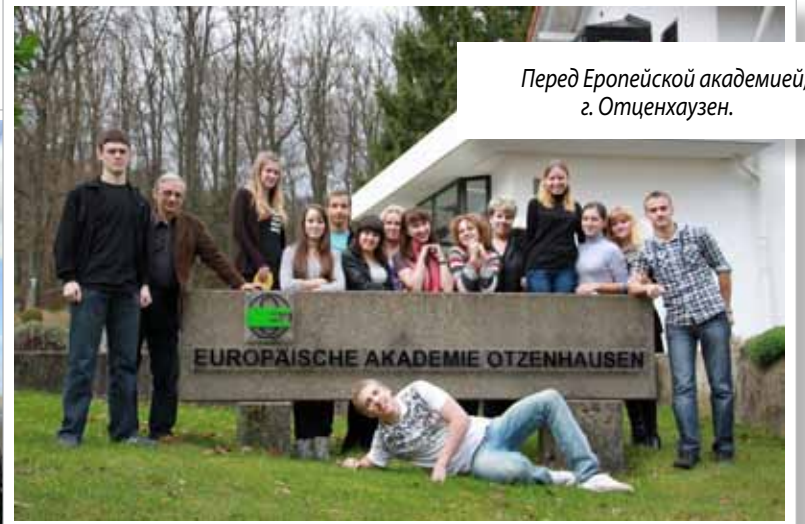
Перед Европейской академией, г. Отценхаузен.