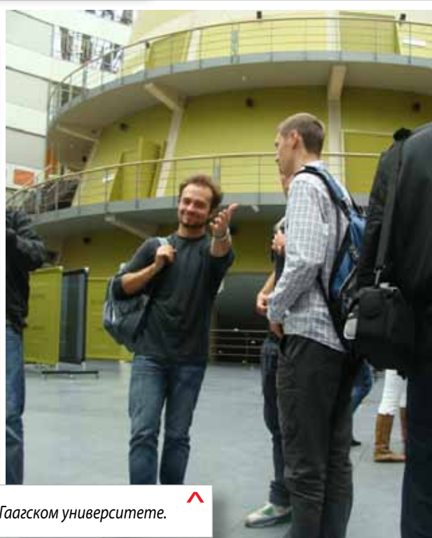
В Гагском университете.

«Почти каждый день мы проводили на уроках в гимназии им. Александра Гумбольдта. Узнали много нового и интересного об образовании в Германии. Ученики в школе имеют намного больше свободы в плане дисциплины и дистанции с учителями. Занятия протекают довольно легко и интересно. Все основывается на практическом применении. Особенно если речь идет о таких предметах, как химия, физика, биология. В школе созданы все условия для проведения различных экспериментов. Учителя воспринимают учеников как себе равных (имеется в виду возрастной аспект). Они могут разговаривать с детьми на очень интересные темы. К примеру, на уроке религии учитель беседовал с детьми на тему: как жить дальше, когда умирает близкий человек? Безумно интересно было слушать пятиклассников, которые очень серьезно высказывали свои мнения на данную тему. Мы сидели, затаив дыхание, пытались запомнить и уловить даже самую мелочь из их высказываний».