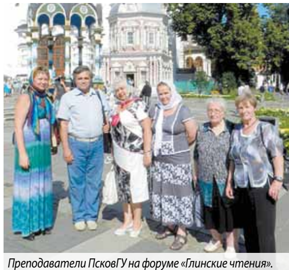
Преподаватели ПсковГУ на форуме «Глинские чтения».

27-30 июля 2012 года в Московской Духовной Академии (Свято-Троице-Сергиева Лавра, г. Сергиев Посад Московской области) прошел Международный образовательный педагогический форум «Глинские чтения», тема форума: «Сотрудничество церкви и государства в духовно-нравственном воспитании подрастающего поколения». В 2012 г. форум был посвящен 80-летию со дня рождения схииеромандрита Иоанна (Маслова), богослова и педагога.