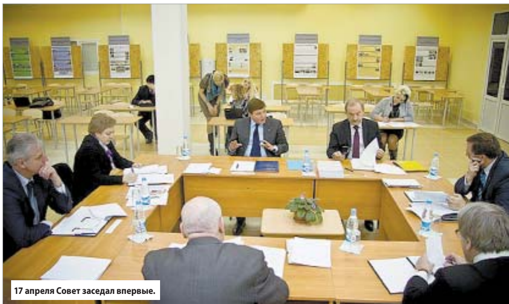
17 апреля Совет заседал впервые.