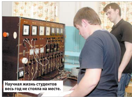
Научная жизнь студентов весь год не стояла на месте.

Но молодежная научная жизнь университета не была ограничена только лишь конференциями. Также среди студентов проводились и предметные олимпиады. В этом году состоялось более 50 предметных олимпиад, охватывающих значительную часть изучаемых студентами дисциплин.