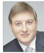
ТУРЧАК Андрей Анотольевич Председатель Попечительского совета, губернатор Псковской области