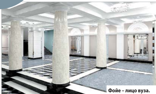
Фойе – лицо вуза.

Фойе и аудитория №63 главного корпуса будут отремонтированы согласно дизайнерским проектам.