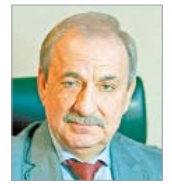
ДЕМЬЯНЕНКО Юрий Анатольевич Ректор Псковского государственного университета