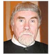
КУРБАТОВ Валентин Яковлевич Член Общественной палаты РФ